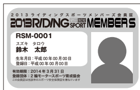
RSM 会員には、このような会員証が送られます。顔写真はこの会員証に使います

主催者からRSM事務局へ申込書が届き次第、保険の加入作業を行ないます。加入が済みましたら、メンバーズカードを発行します。カードには、メンバーの名前、生年月日、会員番号、加入した日にちと、顔写真が入ります。カードは原則、主催者にまとめて送られます。